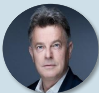
Fabien ROUSSEL Parti communiste français

Programme "La France des jours heureux" - Fabien ROUSSEL 2022