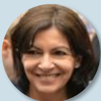
Anne HIDALGO Parti socialiste

Programme HIDALGO !2022 - Anne HIDALGO 2022