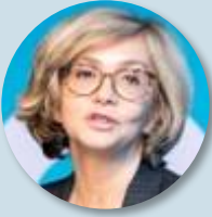
Valérie PECRESSE Les Républicains

Programme « Le courage de faire » - Valérie PECRESSE 2022