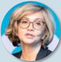
Valérie PECRESSE Les Républicains

Programme « Le courage de faire » - Valérie PECRESSE 2022