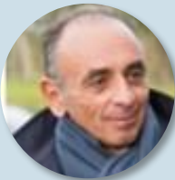
Eric ZEMMOUR Reconquête

Programme « Pour que la France reste la France » - Eric ZEMMOUR 2022