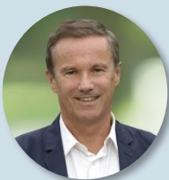
Nicolas DUPONT- AIGNAN