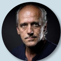
Philippe POUTOU Nouveau parti anticapitaliste