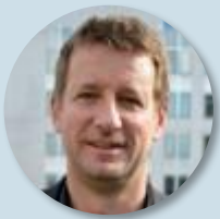
Yannick JADOT Europe écologie- Les Verts

Programme « Changeons ! » - Yannick JADOT 2022