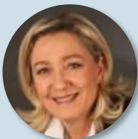
Marine LE PEN Rassemblement national

Programme « M La France » - Marine LE PEN 2022